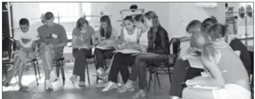
Educatorii de la Egal la Egal au instruit peste 150 de copii în mai multe tabere de vară din Moldova

Activitățile în taberele de vară s-au desfășurat în cadrul proiectului “Extinderea serviciilor de consultanță și informare cu privire la sănătatea reproductivă și prevenirea HIV/SIDA și ITS pentru tineri”, implementat de UNFPA și Ministerul Educației și Tineretului.